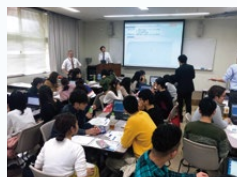
琉球大学での寄附講座