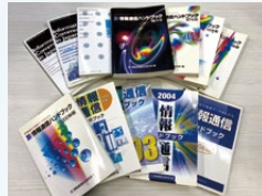
情報通信ハンドブック